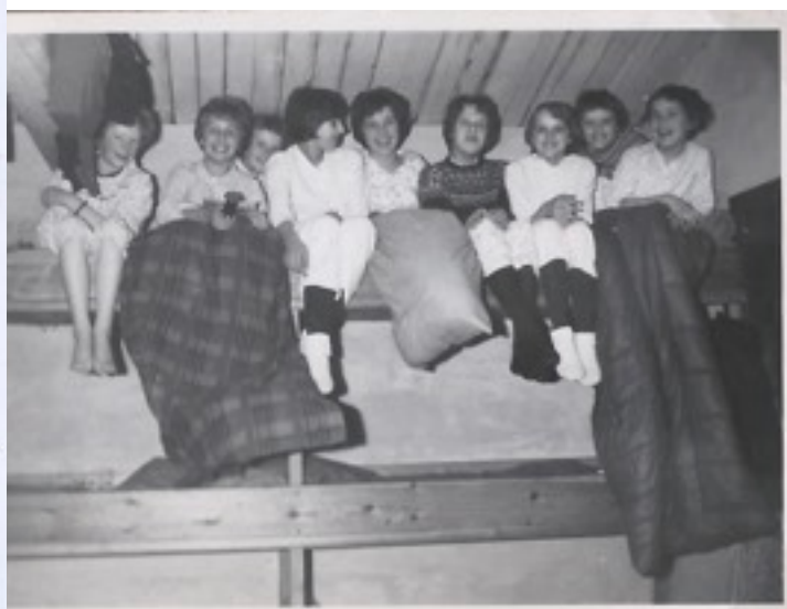
Pigespejdere i øverste køje i 1962 - privat foto.