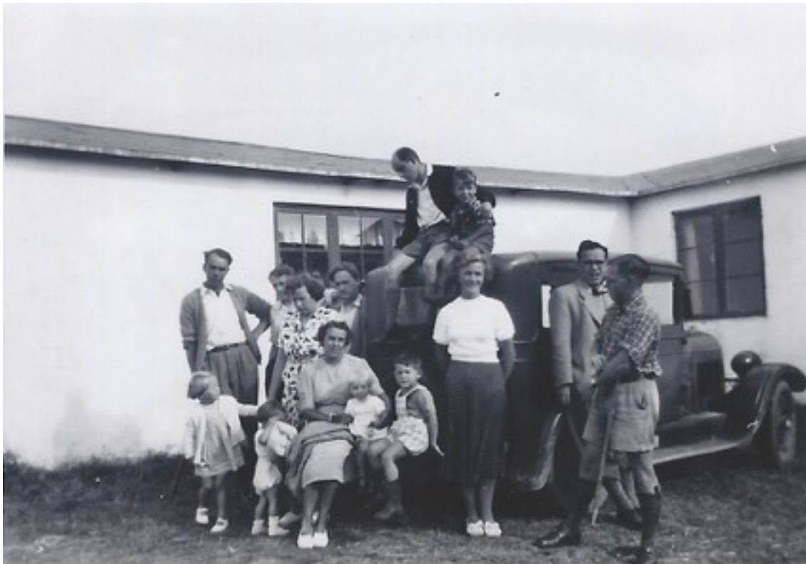
“Sommerlejren” omkring 1952 - privat foto.