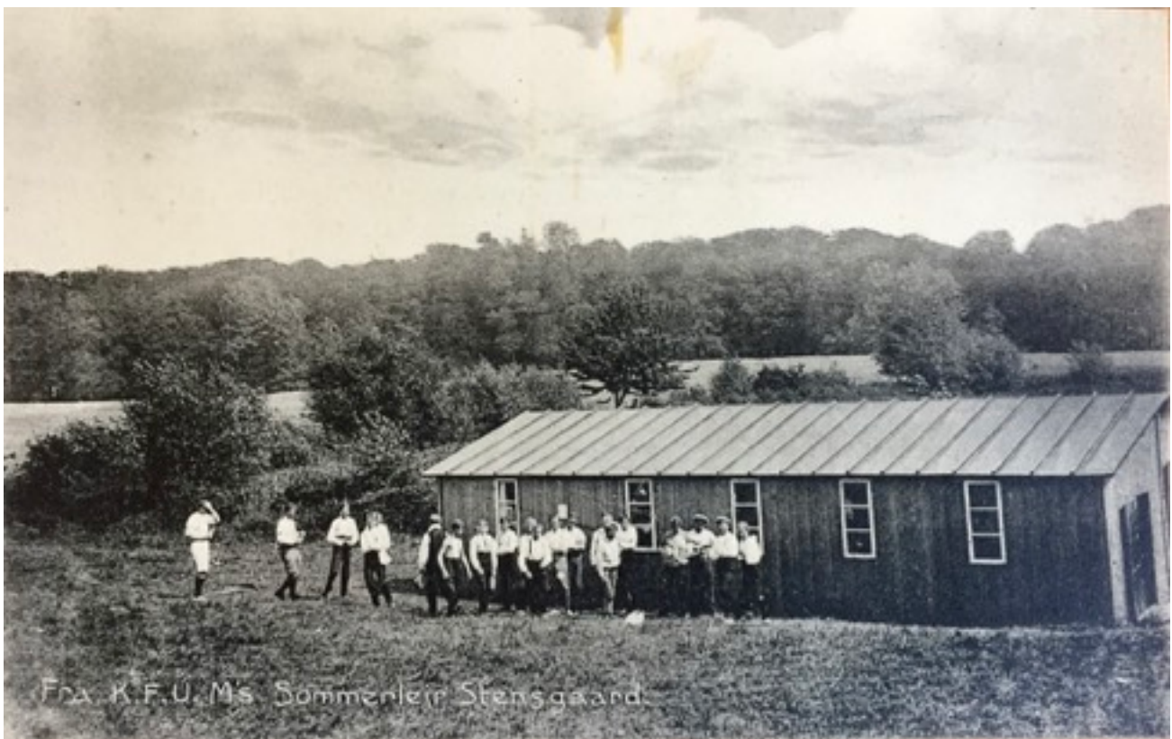
Postkort med "Sommerlejren" ved Steensgård, formentlig taget i 1915.