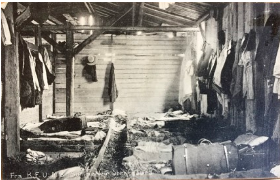
Postkort med motiv af sovesalen i træbarakken ved Steensgård, taget ca. 1915.

Ferieloven var langt fra opfundet i begyndelsen af det tyvende århundrede, men der var et stigende behov for udfoldelse i naturen på fridage, og fridage var søndage og helligdage. KFUM havde allerede fra starten haft ideen til afholdelse af sommerlejre for børn og unge. Der var tre afdelinger, hovedafdelingen - de ældre, ungdomsafdelingen og endelig yngsteafdelingen.