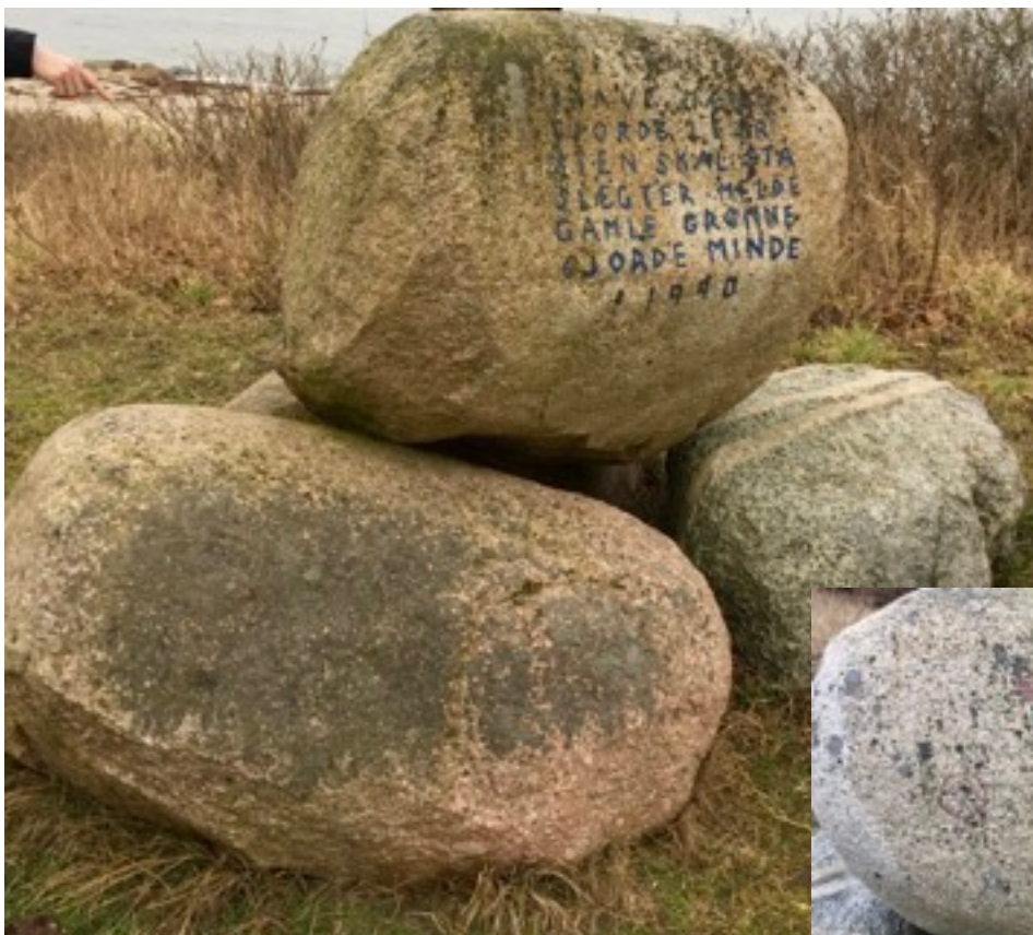
Stenmonument sat af Gamle Grønne - inskription ved Lars Nistrup Jørgensen - privat foto.

Tekst: “BRAVE MÆND GJORDE LEJR STEN SKAL STÅ SLÆGTER MELDE GAMLE GRØNNE GJORDE MINDE 1990”