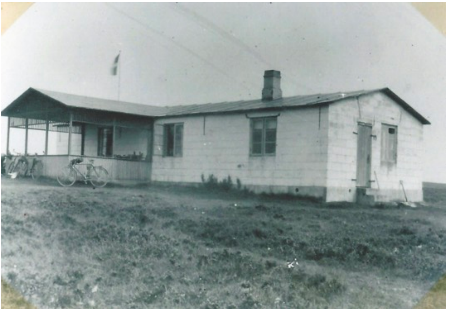
"Sommerlejren" før 1933, hvor den åbne pavillon blev en lukket tilbygning - privat foto.

Når muligheden for transport med hestevogn var tilstede, var det populært - specielt ved dagsture til lejren. Hestevogn blev de første år brugt til at fragte forsyningerne.