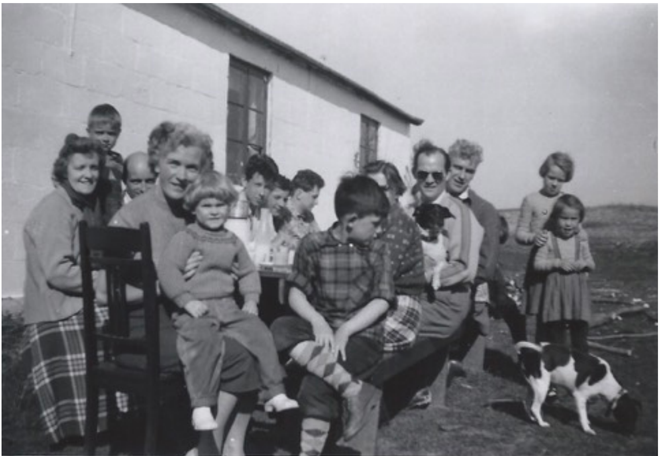
Spejder- og familietræf i Longelse Sønderskov i 1955 - privat foto.

De såkaldte "Gamle Grønne" var en flok gamle spejdere, der i 1986, ved en 60 års fødselsdagsfest hos een af flokken, besluttede sig for at holde et årligt træf omkring Kr. Himmelfartsdagene i "Sommerlejren". De var en uvurderlig hjælp til vedligeholdelsen af huset og omgivelserne gennem 30 år.