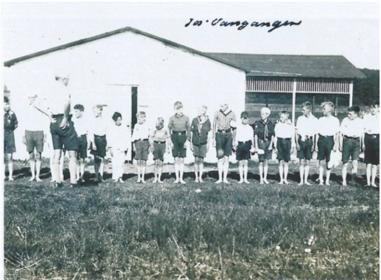
Morgenparade for spejderne i "Sommerlejren" - omkring 1928, privat foto.