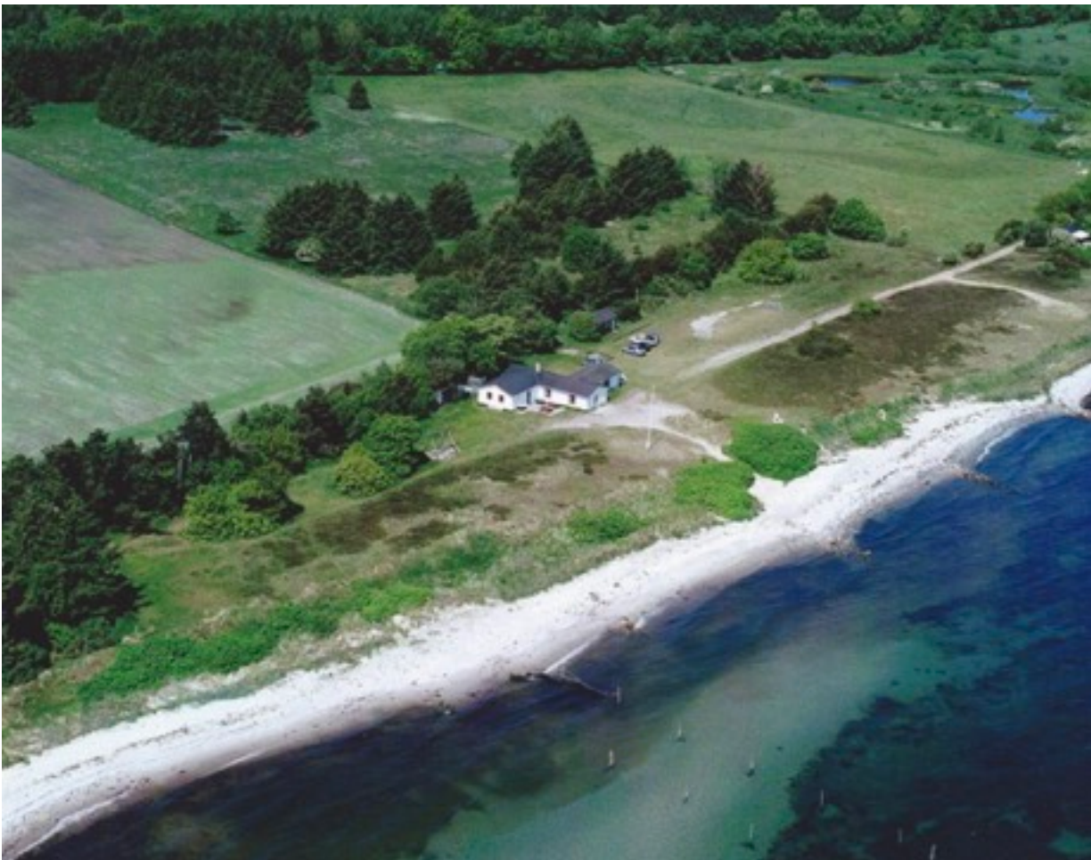
Luftfoto af "Sommerlejren" i Longelse Sønderskov i 2014 - privat foto.

Men den beskrevne betydning af lejren for så mange mennesker gennem hundrede år, vil forhåbentlig kunne indgive styrke og mod til at drive lejren videre på en eller anden facon.