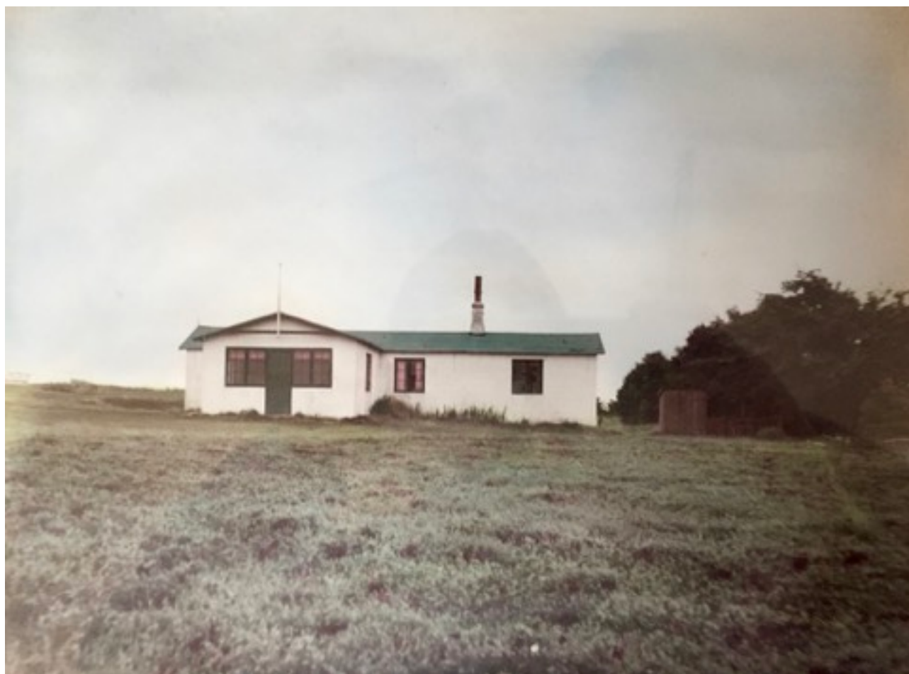
“Sommerlejren” 1948 til 1957. Foto på Byhistorisk Arkiv i Rudkøbing. Donation fra De grønne Spejderes ulveunger, i taknemmelighed.